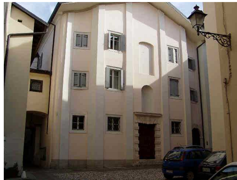
Edificio dell'antica chiesetta di S. Giuseppe; qui Rosmini aveva posto la sede dell'Oratorio. A sinistra si nota il passaggio aereo che collega con la chiesa di S. Marco.