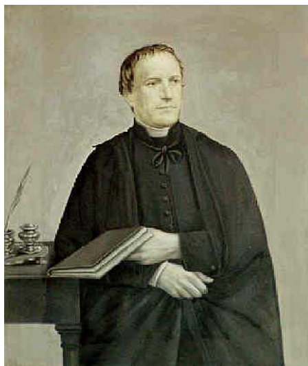
Ritratto (olio su tela databile 1834-1835) di Rosmini parroco di S. Marco conservato nella Casa natale

La Verità soprannaturale, cioè la Parola di Dio, è il principio dell'eloquenza cristiana ...